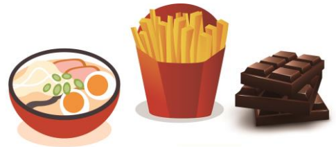
購買食品前認清標示

近年來「雷神巧克力」、「薯條三兄弟」、「一蘭拉麵」、「兔兔棉花糖可可粉」等進口的流行食品，一度引發民眾搶購潮，有些業者因而透過網路直接郵購海外商品(即俗稱「平行輸入」)、或出國旅遊之便攜帶回台灣等管道，將未經食藥署查驗的食品轉售販賣給國人，此販賣行為不但可能觸法，而且購買的消費者還可能買到不符食品安全衛生管理法(下簡稱食安法)的產品，建議消費者可由下列步驟檢視商品：